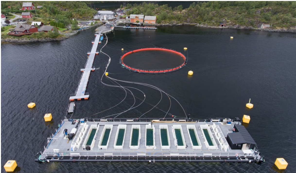
Figur 1 Tubmerd på lokalitet Sagen 2

Rapportering for 2019 i henhold til grønn tillatelse H-SR-5.